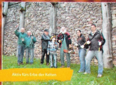
Aktiv fürs Erbe der Kelten