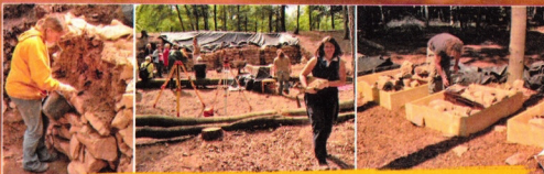
Eine Hauptaufgabe der „Donnersberger Kelten e. V.“: Die archäologischen Arbeiten unterstützen - auch finanziell! Hier ein Beispiel: Der Verein beschaffte die Holzrahmen zur exakten Zwischenlagerung der Grabungsergebnisse.