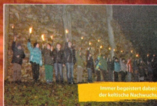
Immer begeistert dabei: der keltische Nachwuchs